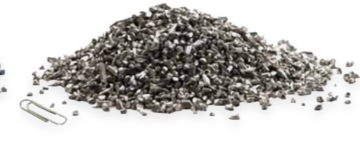
Granalla de aluminio