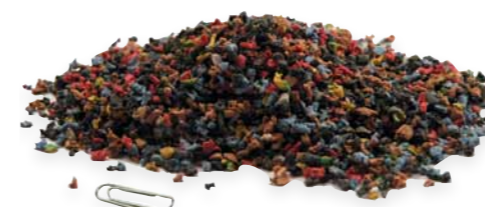
Granalla de plástico/aislante