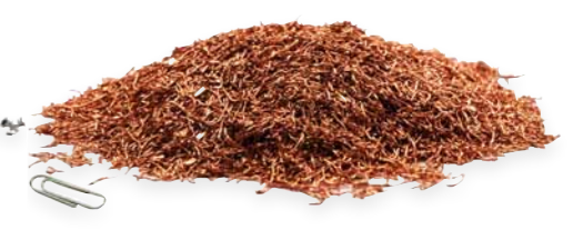
Granalla de cobre